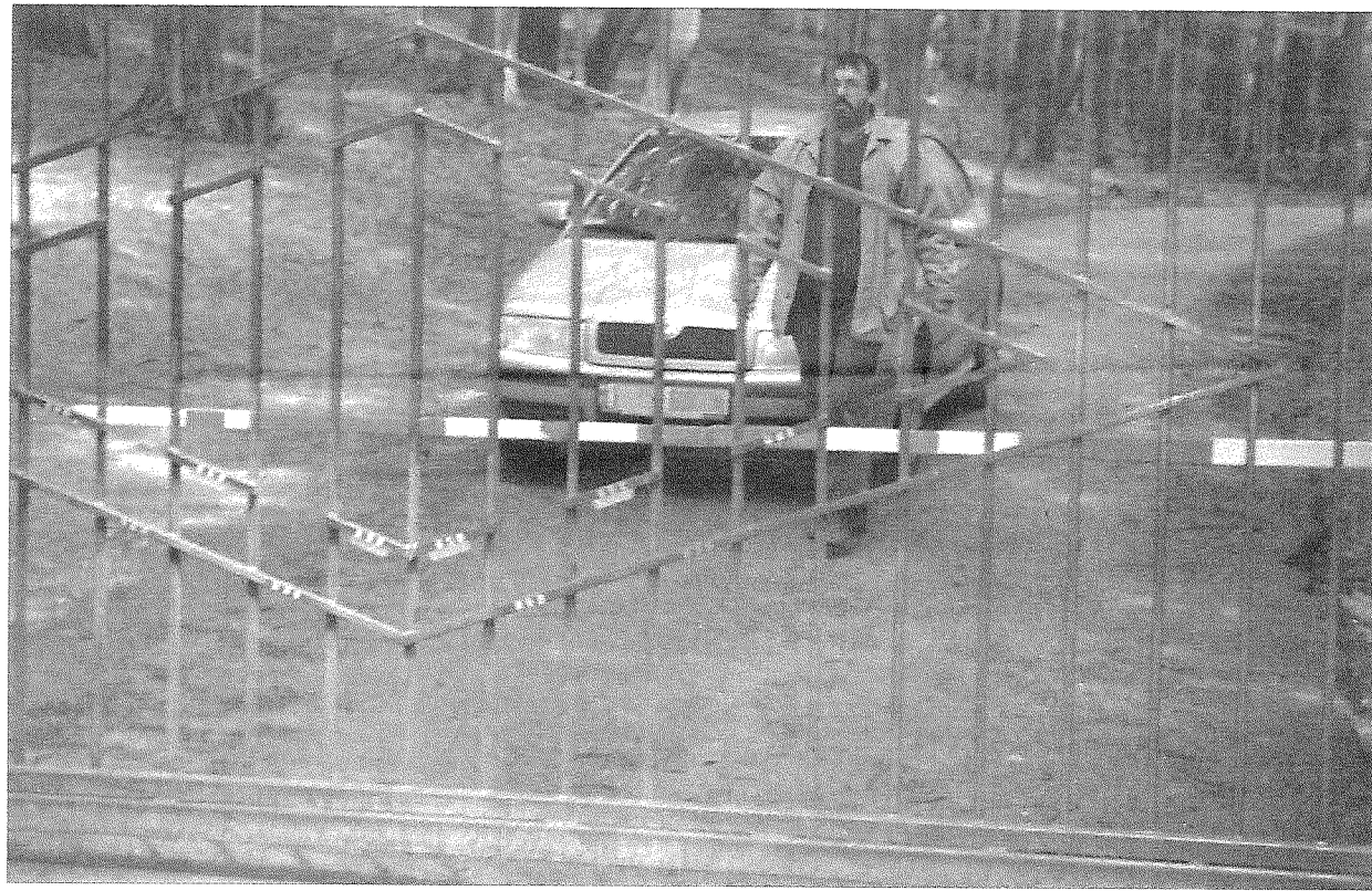
Na terenie ośrodka w Grodnie i wypoczywają tajemniczy ludzie z całej Polski.

Po serii naszych artykułów o WPN minister ochrony środowiska zarządził w parku kontrolę, która odbyła się w dniach 16-27 marca br. Lewicki utajnił jednak protokół pokontrolny przed pracownikami i związkowcami. W poniedziałek,