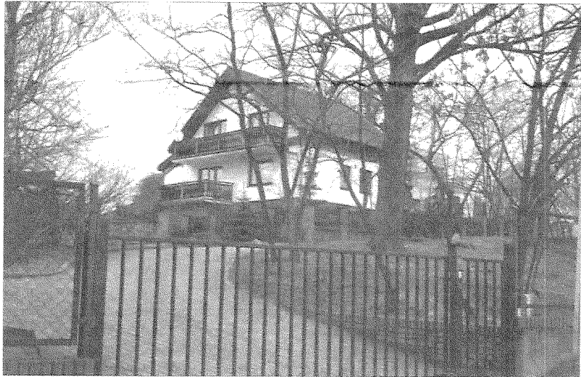
W remont willi Lewickiego WPN zainwestował spore pieniądze. Teraz ten chce ją odkupić, czego jakoś minister nie dostrzegł.

Mirosław KWIATKOWSKI (mkw@kurier.szczecin.pl)