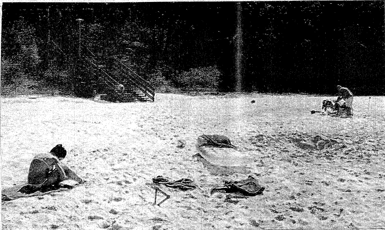
Wejście na teren „bazy ekologicznej”. Na plaży nie ma ani jednego kosza na śmieci. Widocznie „ekolodzy” ich nie potrzebują.

zaskoczonych. W lutym wysłałem zapytanie w tej sprawie do Centrum Obsługi Kancelarii Prezesa Rady Ministrów. Oto odpowiedź: „Racjonalność przekazania ośrodka Wolińskiemu Parkowi Narodowemu wynika z tego, iż Ośrodek Wypoczynkowy Grodno I zlokalizowany jest na terenie Wolińskiego Parku Narodowego, na cennym przyrodniczo obszarze klifowym, objętym ochroną czynną. Teren ten obejmuje