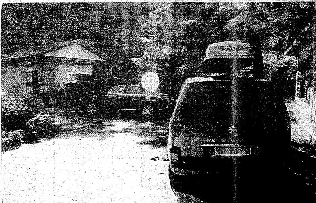
Przed każdym z domków stoją samochody z całej Polski.